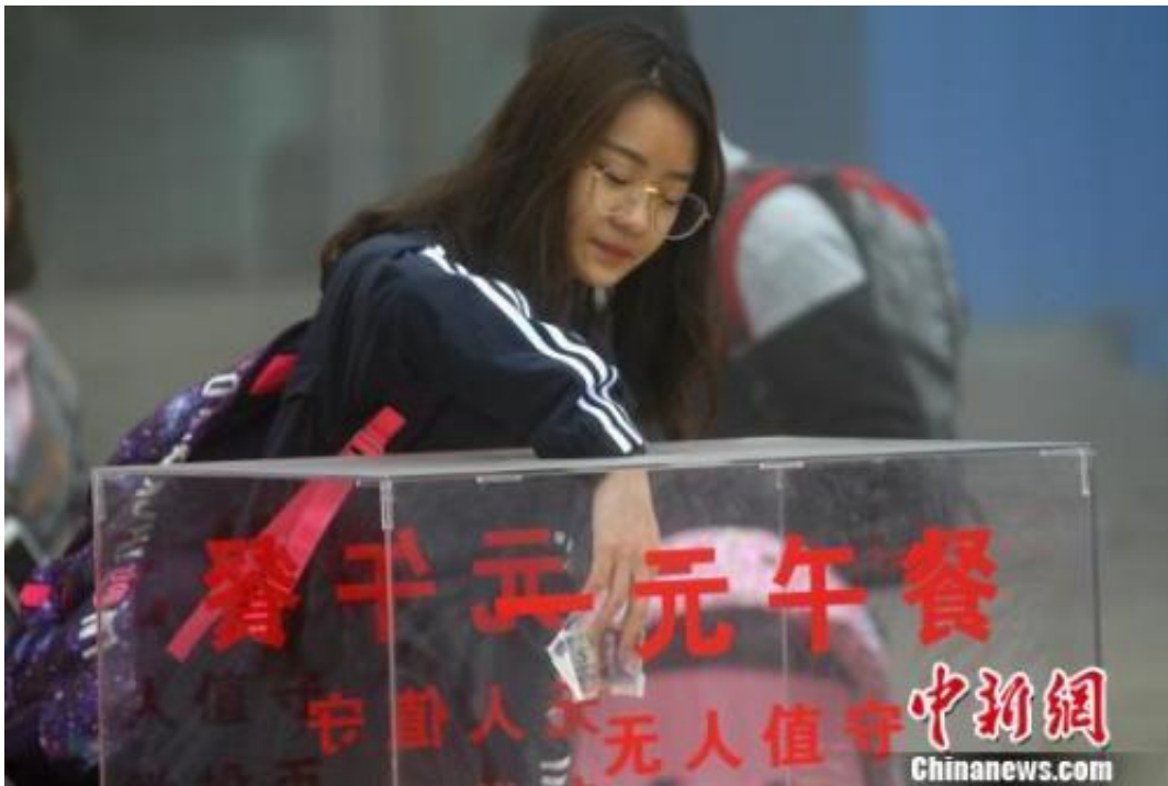
图为游客自觉投币、自助找零购置一元午餐。

其中，河南省栾川老君山景区10月5日推出“1元无人售卖农家面”，无人值守，自觉投币，自助找零，吸引上千名游客前来排队就餐，队伍始终井然有序。当日老君山景区共售出农家面1100份，钱箱内现实收款1167元。现实收款比农家面的份数多出了67元。